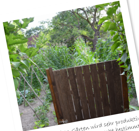
In manchen Gärten wird sehr produktiv gegärt. Das schmeckt bestimmt!

Da es nun langsam wieder kälter wird, wollen wir hier mit einigen Schnapsschüssen die Sommerseite von Steterburg zeigen – und damit allen applaudieren, die Steterburg erblühen lassen und farbenfroh machen!