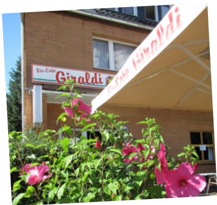
Bei diesen Blüten bekommt man doch Lust auf ein Erdbeereis, oder?