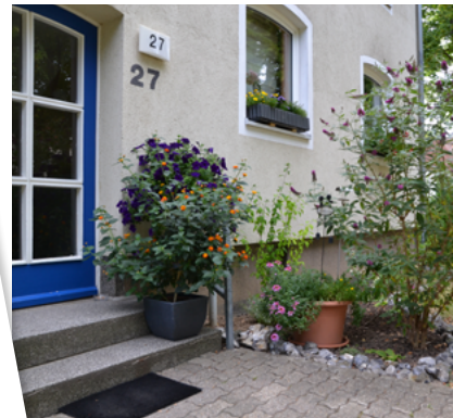
Blumen und blühende Sträucher bieten einen freundlichen Empfang.