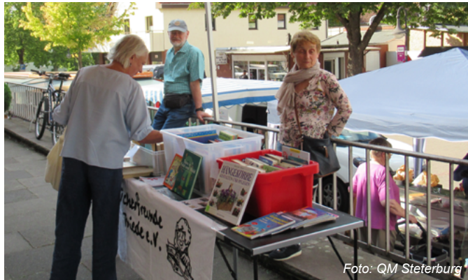
Auch beim MarktTreff sind die Bücherfreunde mit einem Stand dabei.

Schauen Sie doch mal bei uns rein, wir freuen uns auf Ihren Besuch! (Öffnungszeiten: Montag von 17-19 Uhr, Mittwoch und Donnerstag 15.30-17.30 Uhr)