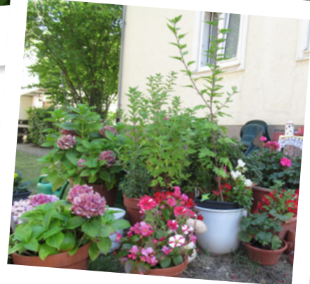
Besonders bunt ist es dort, wo verschiedenes zusammenkommt.